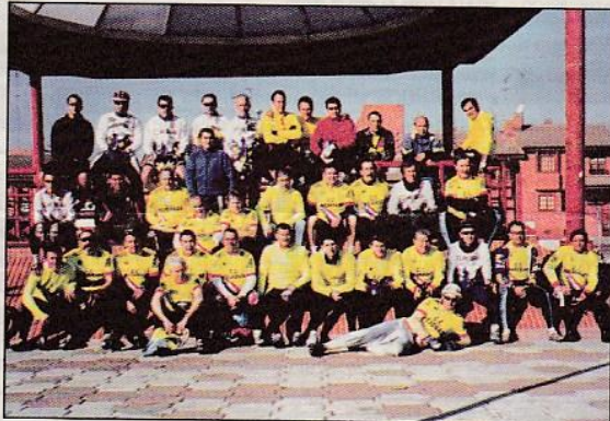
Los integrantes del Club Ciclista, en la foto de equipo que se realiza al comienzo de cada temporada

Es una buena oportunidad, por tanto, de combinar deporte, naturaleza y diversión y sin marcharse muy lejos de casa, que ofrecen, año tras año, los componentes de la sección de Bicicleta Todo Terreno del Club Ciclista Mejorada.