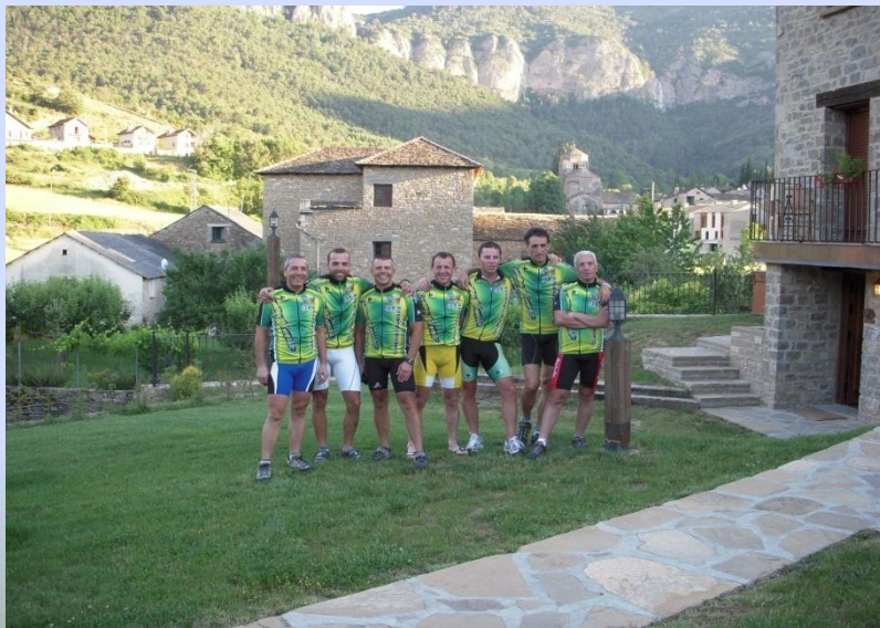
Participación del Club MTB Mejorada en la Quebrantahuesos