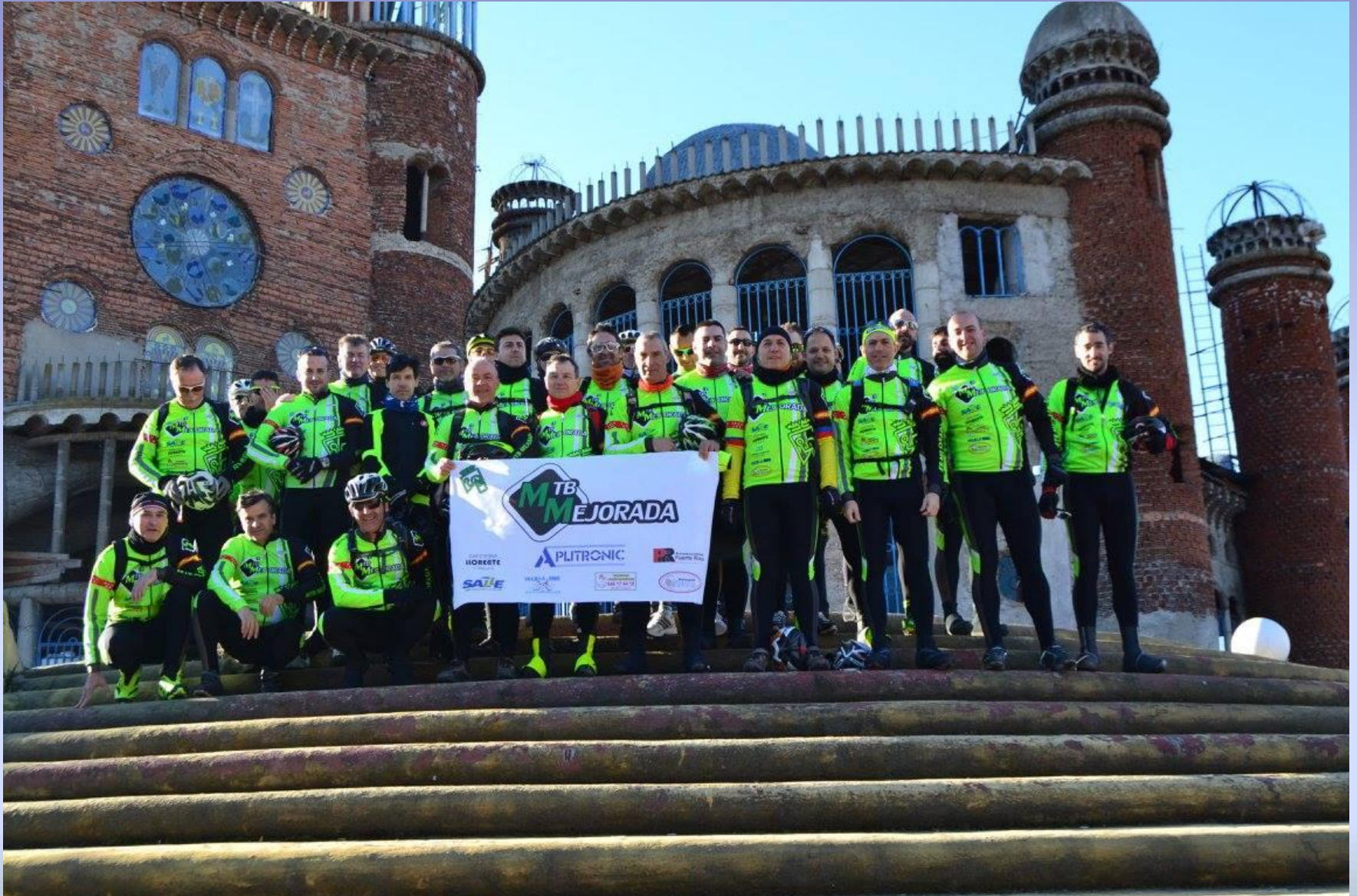
Foto oficial de la inauguración de la temporada Marzo 2016