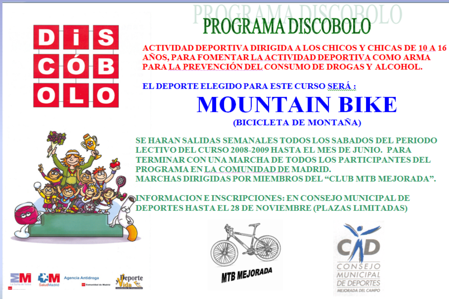
Cartel anunciador del programa